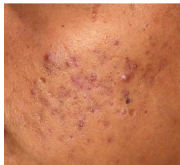
Hautbild vor und nach Aknenarben-Therapie mit LUTRONIC GENIUS®. (Individuelle Ergebnisse können variieren.)

verbessert Narben, Hautstruktur, Falten und Schlaffheit an Gesicht, Hals, Bauch und weiteren Arealen. Verschiedene Nadelaufsätze ermöglichen die gezielte Behandlung kleiner und auch schwer erreichbarer Areale als auch eine schnelle Abdeckung größerer Areale.